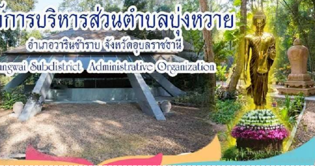
นายกองค์การบริหารส่วนตำบลบุงหวาย