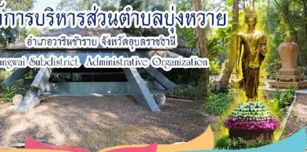
นายกองค์การบริหารส่วนตำบลบุงหวาย