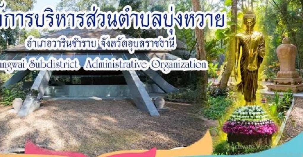
นายกองค์การบริหารส่วนตำบลบุงหวาย