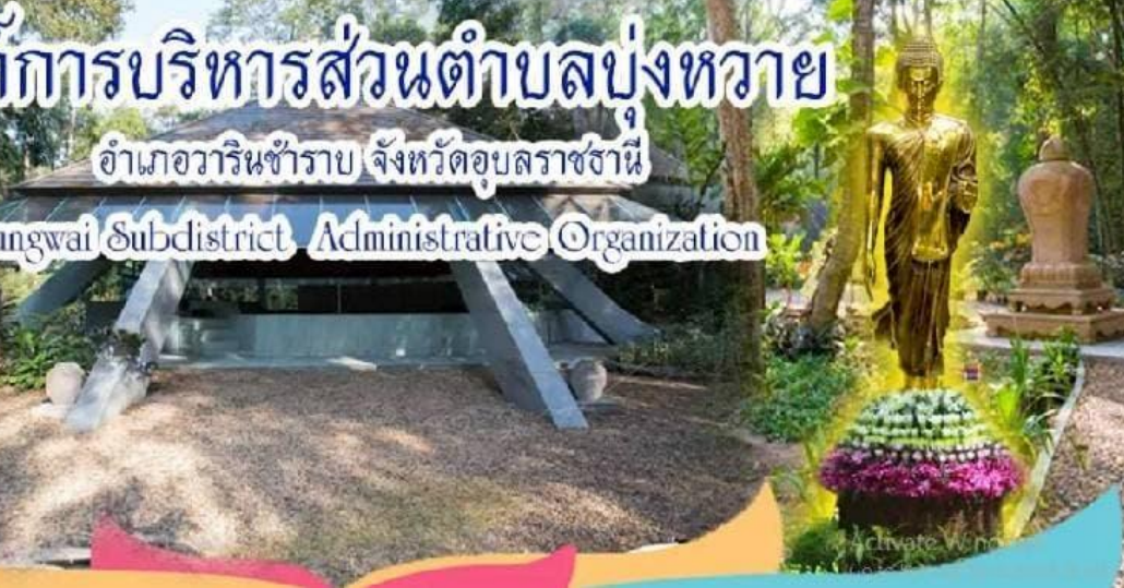
นายกองค์การบริหารส่วนตำบลบุงหวาย