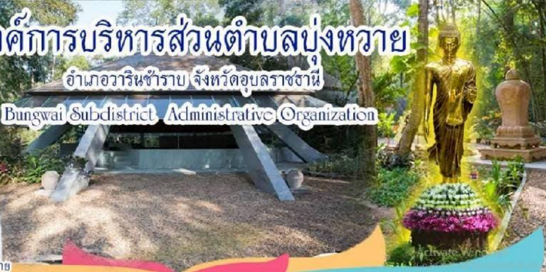
นายกองค์การบริหารส่วนตำบลบุงหวาย